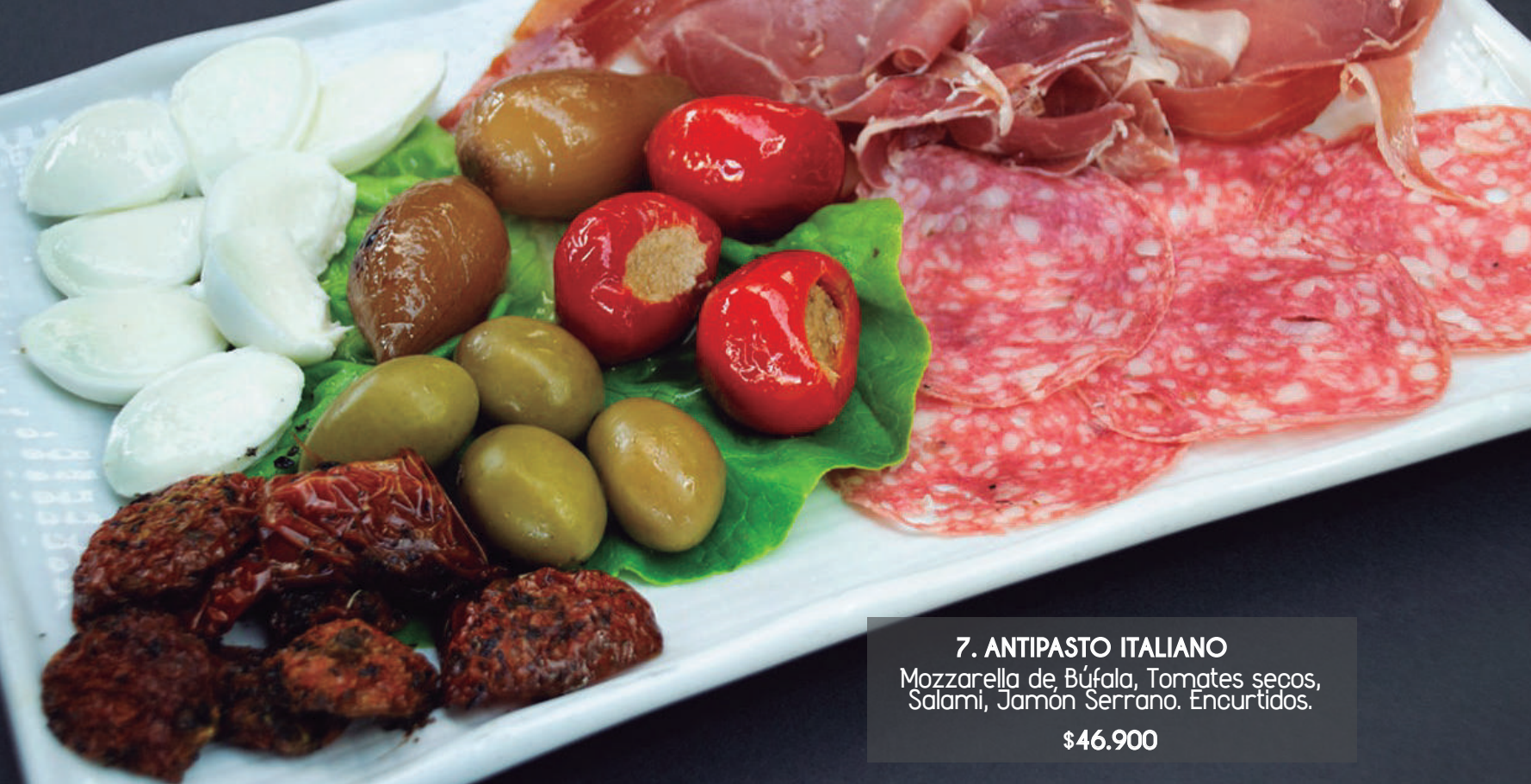
7. ANTIPASTO ITALIANO Mozzarella de Búfala, Tomates secos, Salami, Jamón Serrano. Encurtidos. $46.900