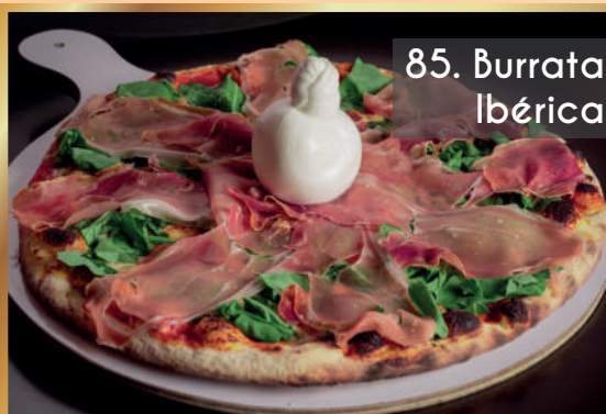
85. Burrata Ibérica