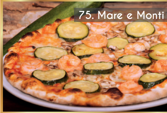
75. Mare e Monti