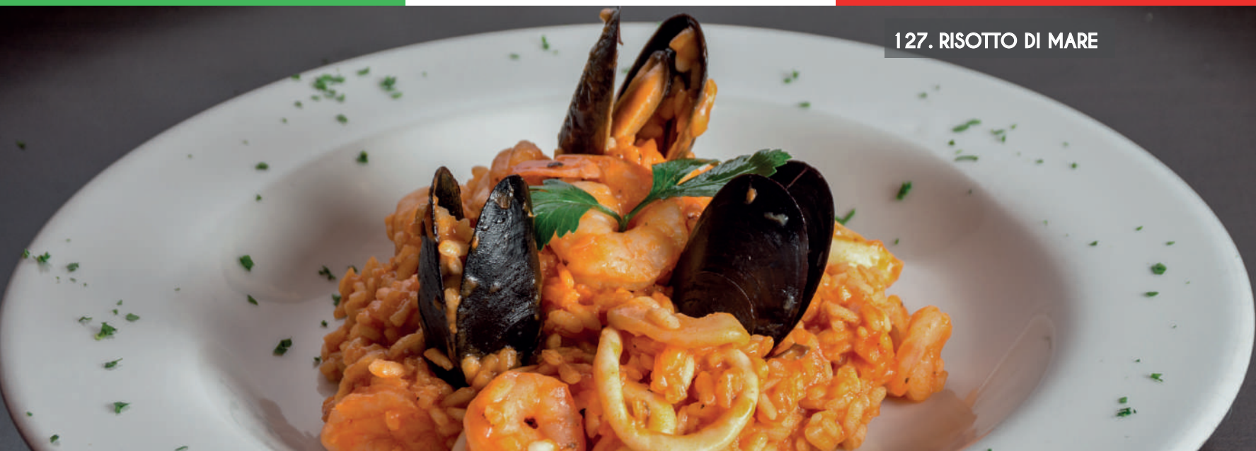
127. RISOTTO DI MARE