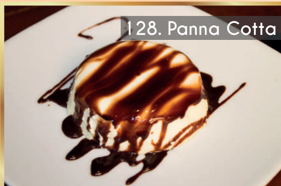
128. Panna Cotta