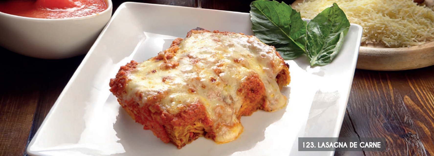
123. LASAGNA DE CARNE