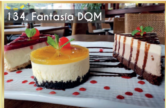
134. Fantasía DQM