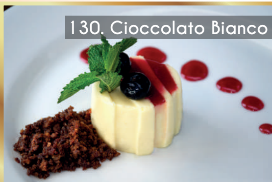
130. Cioccolato Bianco