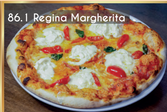
86.1 Regina Margherita