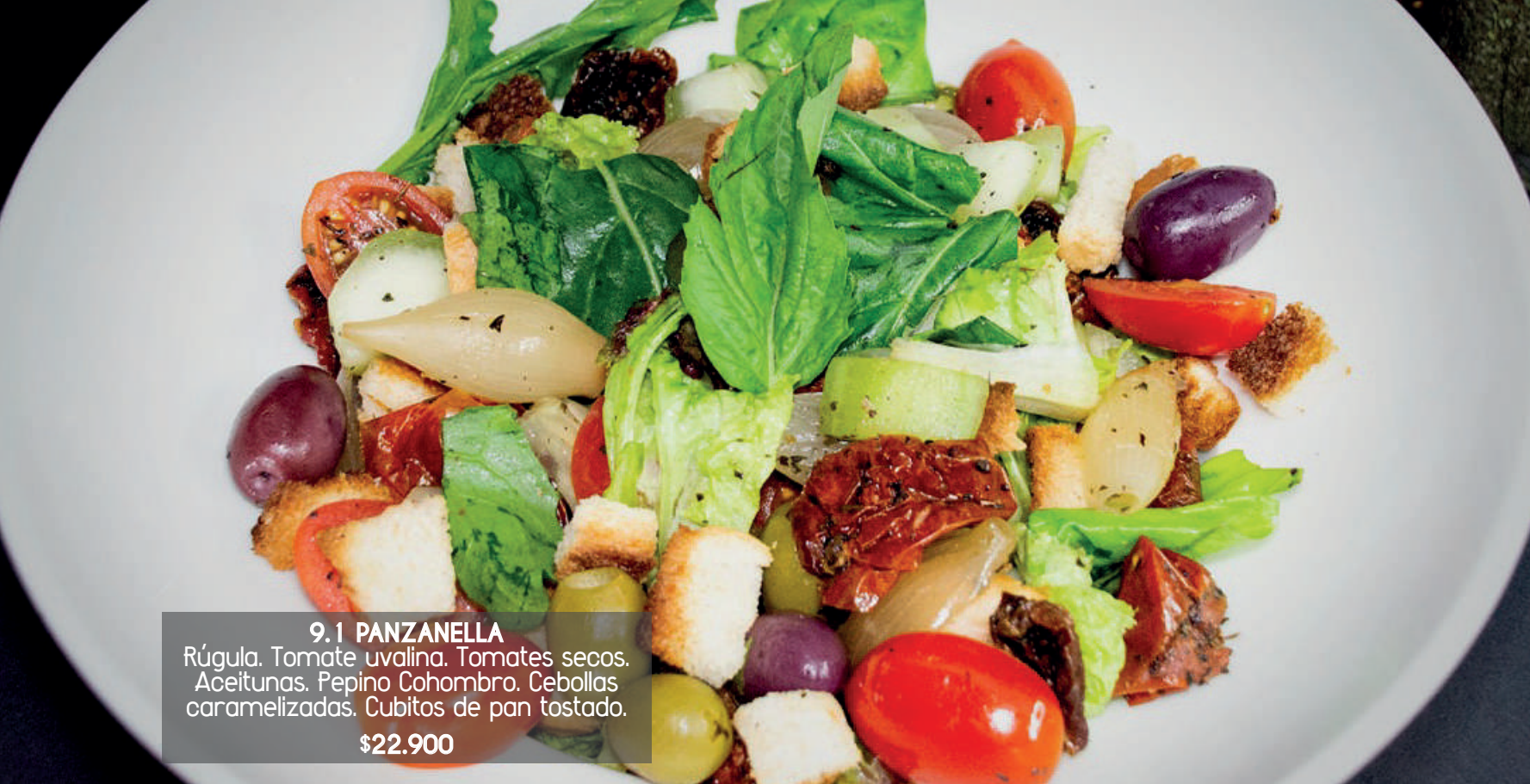
9.1 PANZANELLA Rúgula. Tomate uvalina. Tomates secos. Aceitunas. Pepino Cohombro. Cebollas caramelizadas. Cubitos de pan tostado. $22.900