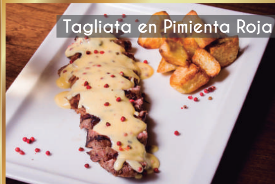
Tagliata en Pimienta Roja