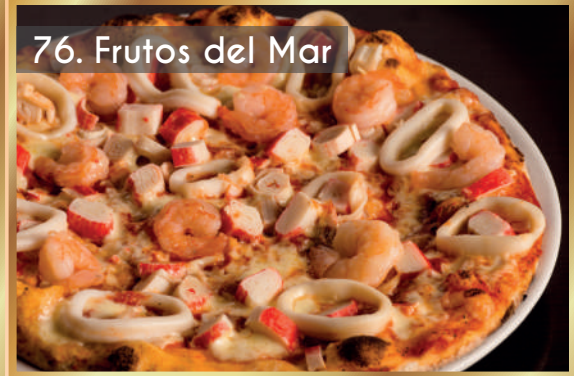
76. Frutos del Mar