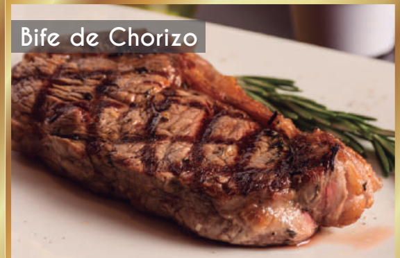
Bife de Chorizo